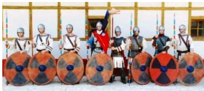
Legio Leonum az állandó partnerünk